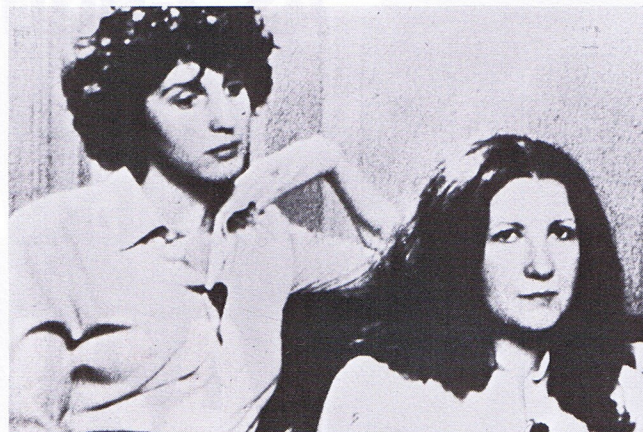
Des fragments de bonheur

Réalise quelques court-métrages, devient assistant-réalisateur à la RTBF.