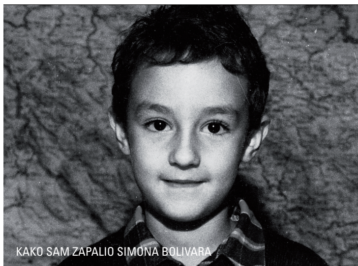
KAKO SAM ZAPALIO SIMONA BOLIVARA

Je crois à une hybridation entre fiction et documentaire. Je trouve que la recherche de l'authenticité a été surévaluée par le passé et que nous vivons aujourd'hui dans un monde "post-authentique". C'est pour cela que ces deux genres ont tendance à s'entremêler. Les cinéastes ressentent de plus en plus l'urgence de s'engager sur ces frontières, sur ces chevauchements, et le produit de ces inte-